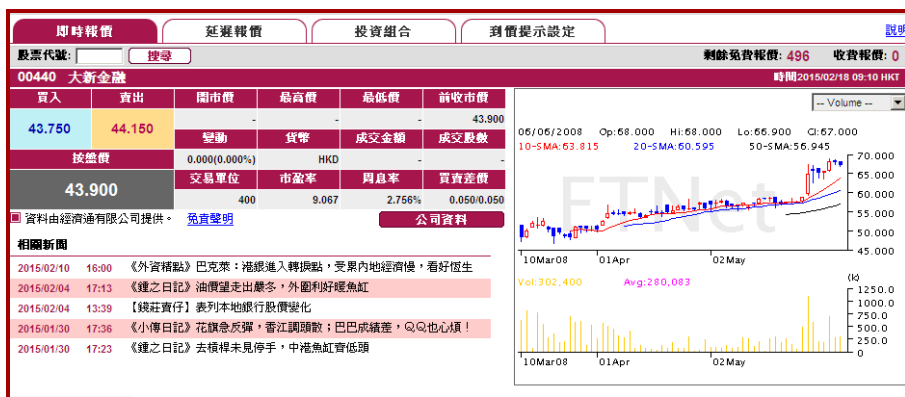
(經濟通 ET Net 版面)