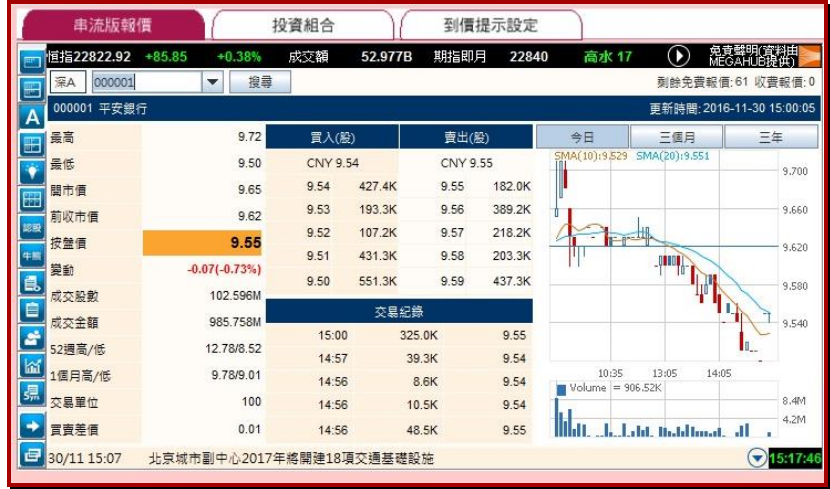
( 天滙財經 MegaHub 版面 )