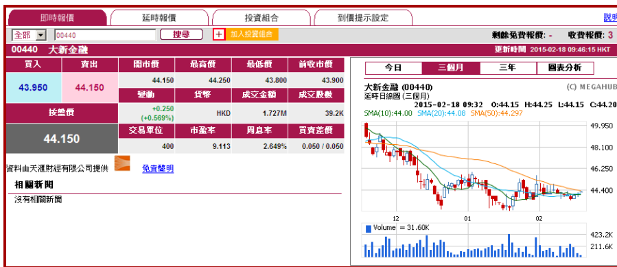
(天滙財經 MegaHub 版面)