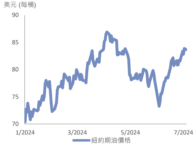
圖一：油價由6月低位大幅反彈